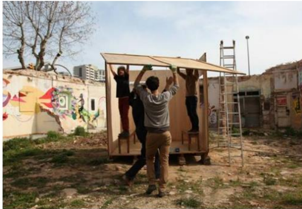
Una cabaña para acabar la tesis (2014) - P. V.

Supo que se dedicaría al arte en el momento en que... Aún no ha llegado ese momento.