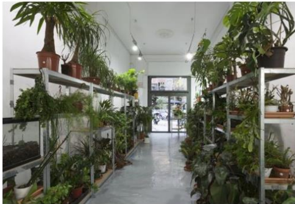
Vista de la instalación «Who wants to be an impatient gardener», ahora en galería ADN - P. V.

¿Por qué tenemos que confiar él? No creo que tenga que haber una relación directa entre la confianza depositada en uno, y lo nuevo (la novedad) que esa persona aporta. A partir de aquí, cada uno decidirá el porqué tiene (o no) que confiar en mí. Yo confío en mí porque me gusta mucho lo que hago y trabajo a destajo hasta que sale adelante, pero ésta es una opinión muy personal al respecto.