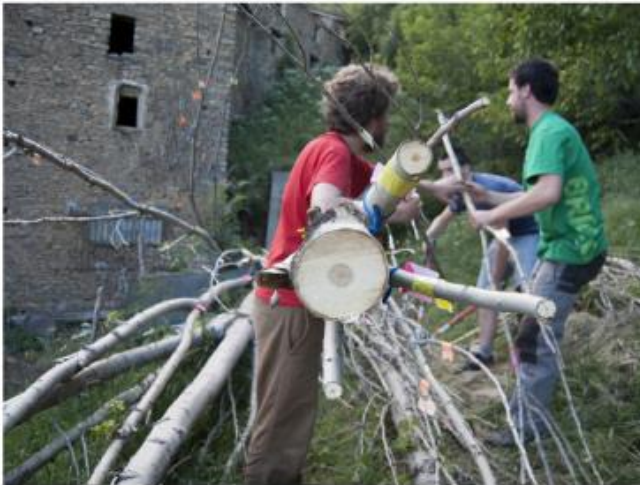
Pep Vidal, 19-metre tree, Image courtesy of ADN Gallery, Paula Artés (C)

2 Jul – 19 Sep 2015 at ADN Gallery in Barcelona, Spain