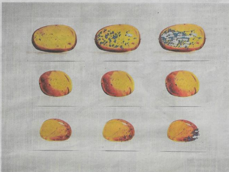
CARLES PALACIO / BÒLIT

El físico Pep Vila calcula el volumen de aire de una piedra de ámbar que tiene millones de años