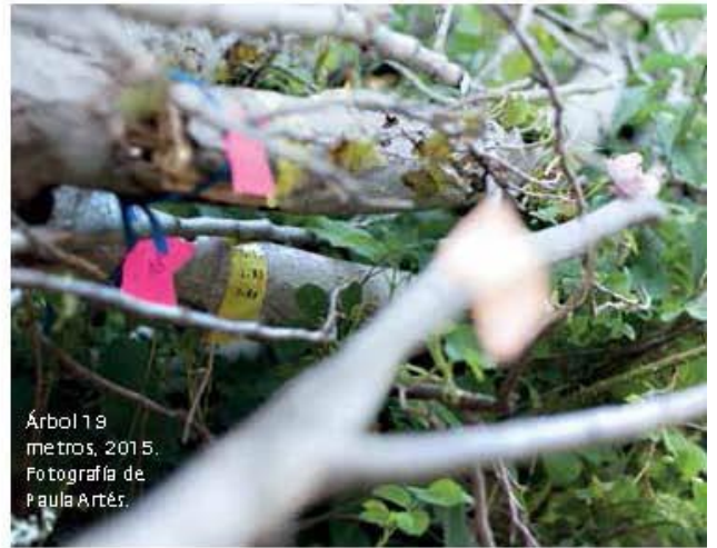
Árbol 19 metros, 2015.

Lo imperceptible para el ojo humano es foco de atracción para este creador. Matemático y doctorado en física, la instalación y el vídeo que ahora presenta nacieron al contemplar unas perfectas hileras de árboles que le llamaron la atención en un trayecto en tren de Barcelona a Girona. Resultó que esa organización espacial estaba manipulada por el ser humano, pero el crecimiento vegetal no, y aun así había respetado la composición artificial. Fue entonces cuando Vidal se cuestionó que no todo lo que nos parece por azar, lo es, y no todo lo natural carece de un sistema preciso para desarrollarse. Después emprendió este estudio con el fin de hallar una regla, un patrón de lo salvaje. Hasta el 12 de octubre. ■ SARA VALVERDE