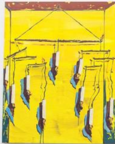
Les gires d'edició de la galeria Esteban - De la Mata signifiquen un repte per als artistes a l'hora de desenvolupar i fer els seus projectes.

L'1 d'octubre marca el tret de sortida d'aquest cap de setmana d'art amb una festa al Mada , gratuïta i oberta a tothom, i la inauguració de les diferents exposicions proposades per les 21 galeries que participen en l'esdeveniment, a què també s'han sumat els museus i les fundacions oferint horaris especials, i altres espais independents de la ciutat. "Les galeries ofereixen una programació d'art gratuïta, estan sempre obertes i encantes que hi pugis entrar", diu Mora. Així doncs, apropem-nos a algunes d'aquests espais i descobrim les seves propostes.