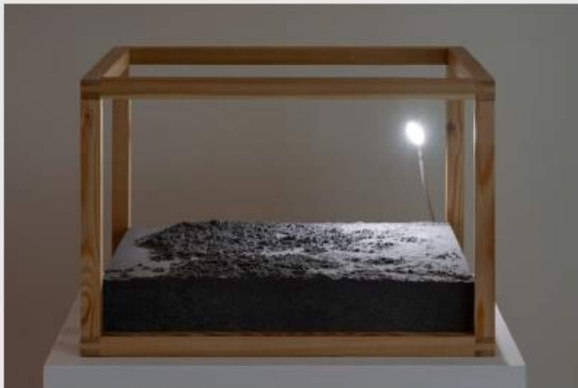
Alán Carrasco, Niemandsländ (detalle) , 2023

En el corazón de la exhibición, encontramos obras transdisciplinares que examinan las complejas relaciones entre las plantas y nuestras estructuras sociales. Este viaje artístico incluye imágenes de plantas en libros y exposiciones, así como la presencia de plantas en contextos menos tradicionales, como zonas de demarcación, invernaderos industriales y contenedores de compost excedente.