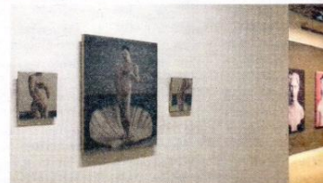
A dalt, 'Flora' (Oleg Dou, 2015). A sota, la galeria Lab 36.