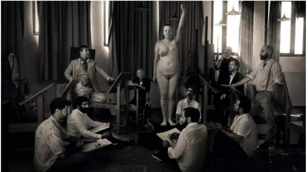
'Romper el canon', obra ganadora del Premio Fotografía de la Fundación ENAIRE 2023 Marina Vargas / PHotoEspaña

El Festival Internacional de Fotografía y Artes Visuales inaugura su 26 o edición. Marina Abramović, Louis Stettner, Marie Høeg, Bolette Berg, Fina Miralles y Marivi Ibarrola, entre sus nombres más destacados