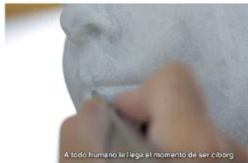
Intra-Venus , 2021. Vídeo. 4' 15