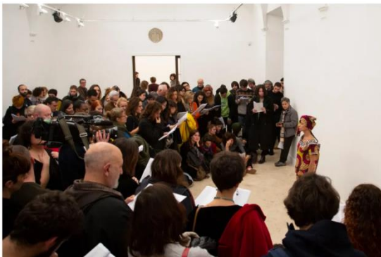
En su presentación Regina José Galindo presentó las historias de mujeres en el mundo.

En las salas se escucha la voz de una mujer de Somalia, que huyó de un matrimonio forzado para llegar a Libia, donde sufrió torturas durante meses antes de conseguir llegar a Italia, o el de otra mujer, del Kurdistán turco, cuyos hermanos fueron asesinados por cantar y escribir poesía en kurdo.