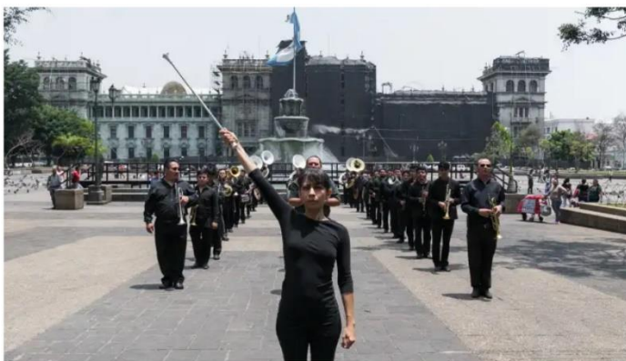
‘El Gran Retorno’ es una acción realizada por Regina José Galindo en 2019 junto a 45 músicos.

Durante más de dos décadas, Regina José Galindo ha encarnado la metáfora de lo que para ella significa existir y ser vulnerable en este país ; uno que según apunta, ha sido construido sobre historias de violencia y tortura hacia los derechos humanos , así como de discriminaciones raciales y de género .