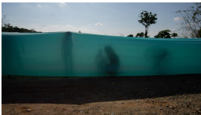
Regina José Galindo, "Ríos de Genta," Guatemala (2020), commissioned and produced by Maz de Vida

WATER MILL, New York — In Guatemalan artist Regina José Galindo's solo show, The Body , at The Watermill Center in the Hamptons, drawings, photographs, sculptures, and videos of performances spanning 20 years consider how a universal object — the body — can speak to issues of human rights.