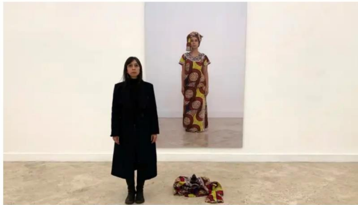
Regina José Galindo, artista visual guatemalteca conocida por sus performances contra el racismo y la violencia hacia las mujeres, posa junto a una de sus obras en la instalación llamada "Lavarse las manos", en Roma.

Regina José Galindo, artista visual guatemalteca conocida por sus performances contra el racismo y la violencia hacia las mujeres, entra en una sala seguida por unas doscientas personas, se quita su ropa y se pone la de una mujer refugiada, mientras de fondo se escucha su testimonio de migración y lucha.