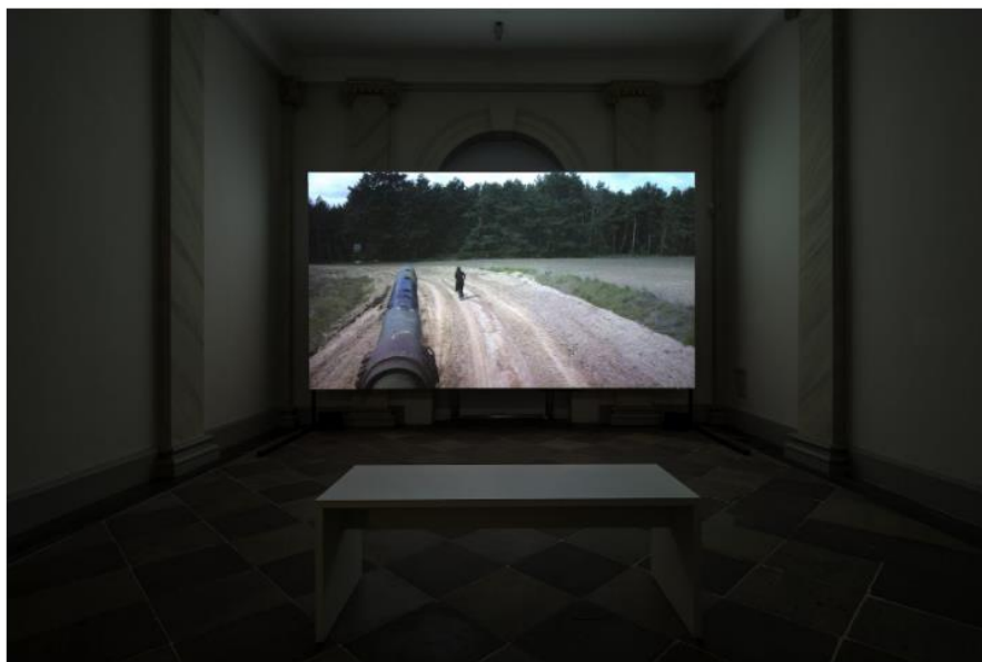
Regina José Galindo, La sombra (Der Schatten), 2017, Video, Installationsansicht, Palais Bellevue, Kassel, documenta 14, Foto: Daniel Wimmer

The work at the Palais Belevue, titled La Sombra (The Shadow), is a video of Galindo performing with a Leopard tank. The “shadow” is the moving tank, from which the body of the artist runs until exhaustion. It looks just like the ones parked in the parking lot in the screenshot my friend took on Google Earth. Galindo’s video-performance thus brings the unsuspected geography of Kassel’s weapon arsenal into the exhibition space of documenta, simultaneously evidencing the entanglement of the apparatuses of art and war in the context of documenta 14, and the contradictions of her own work as a critical device situated within the framework of the problem.