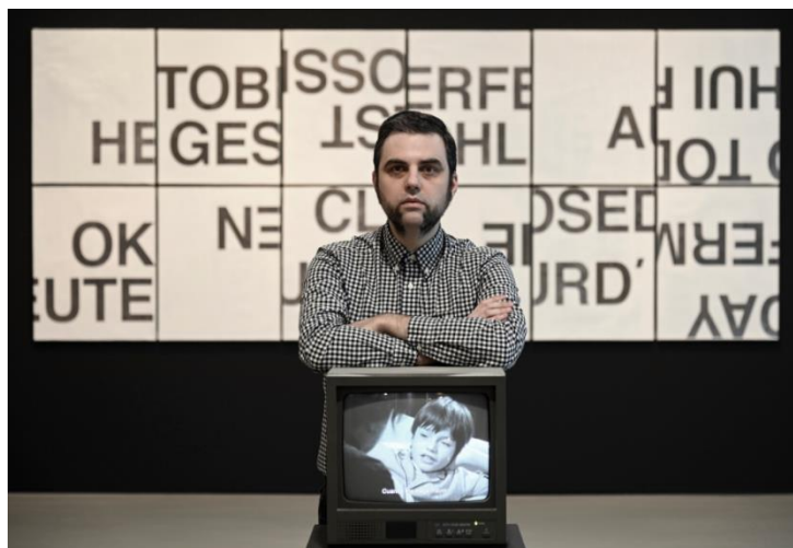
ALÁN CARRASCO (Burgos -España, 1986)

Alán Carrasco es artista visual e investigador doctoral. Su producción artística está conceptualmente ligada a su trabajo de investigación teórica. Así, su obra se centra en los mecanismos de construcción de los relatos oficiales, prestando especial atención a estrategias narrativas como la inducción selectiva de memoria y de olvido y la función de la iconoclastia. Está especialmente interesado en los márgenes de los relatos históricos y en el análisis de las razones por la que algunos aspectos y actores fueron sistemáticamente eliminados de los mismos. En proyectos recientes ha trabajado también con lo que llama "posibilidades de la historia", es decir, eventos de cuya verosimilitud no estamos seguros pero que son, en todo caso, plausibles.