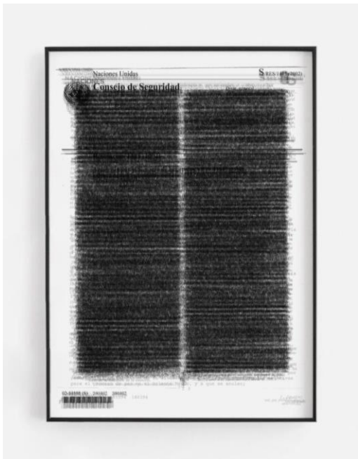
Alán Carrasco, Papel mojado , 2020.

Es evidente el hondo alcance de las heridas de la Segunda Guerra Mundial en toda Europa. Entre ellas la Shoá , un genocidio sistematizado que pretendió la destrucción, entre otros, del pueblo judío. El movimiento sionista hizo de la necesidad de refugio virtud y, tras 60 años de esfuerzos diplomáticos y tras la guerra árabe-israelí de 1948, constituyó su proyecto étnico-religioso bajo la forma de estado-nación: se fundaba Israel sobre el territorio de la Palestina histórica. La Nakba dejaba por el camino miles de historias de exilios, ejecuciones y desposesiones para los palestinos. Papel mojado (2020) da cuenta de todas las resoluciones sobre “La cuestión de Palestina” que el Consejo de Seguridad de las Naciones Unidas ha emitido desde entonces y durante más de siete décadas, al tiempo que remite a una problemática que, rebasando ampliamente los límites temporales del siglo XX, lamentablemente hoy sigue siendo un tema de candente actualidad.