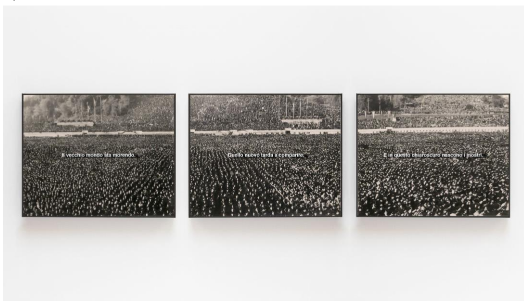
Alán Carrasco, I Mostri , 2021.

Convinced that he deserved international relevance, the leader of Italian fascism did not hesitate to intervene in the Spanish Civil War, sending his volunteers to what would be their first major defeat: the Battle of Guadalajara. Humiliated and thirsting for revenge, a year later he would unleash unilateral air raids over Barcelona. El discreto encanto de la burocracia (2021) reminds us that military orders, apparently sterile and with their characteristic bureaucratic cadence, have terrible consequences.