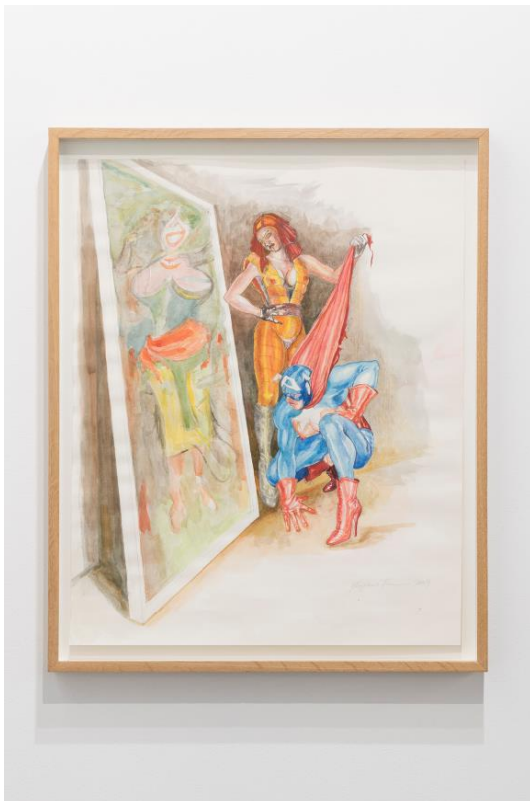
Margaret Harrison, What's that long red limp wrinkly thing you're pulling on? 2009.

Ya en la década de 1990, la artista retomó su práctica de dibujo satírico en una serie que, con una estética próxima a la del caricaturista underground Eric Stanton, presentaba personajes de cómic hipersexualizados junto a iconos de la historia del arte. Como ejemplo se presenta What's that long red limp wrinkly thing you're pulling on? (2009) en el que Lady Deathstrike y el Capitán América admiran Mujer y Bicicleta de Willem de Kooning. Al dibujar al Capitán América con grandes pechos, tacones altos y ligas, la artista no solo desafía al machismo implícito en la representación de la mujer, sino también las concepciones restrictivas de la identidad sexual y la heterosexualidad. Su apropiación del superhéroe abre una nueva vía para la crítica visual feminista, al tiempo que continúa desafiando los roles de género en la cultura mainstream .