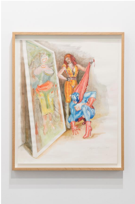
Margaret Harrison, What's that long red limp wrinkly thing you're pulling on? 2009.

In the 1990s, the artist returned to her practice of satirical drawing in a series that, with an aesthetic close to that of the underground cartoonist Eric Stanton, presented hypersexualised comic characters alongside icons from art history. An example is What's that long red limp wrinkly thing you're pulling on? (2009) in which Lady Deathstrike and Captain America admire Willem de Kooning's Woman and Bicycle . By depicting Captain America with large breasts, high heels and garters, the artist not only challenges the male chauvinism implied in the representation of women, but also in the restrictive conceptions of sexual identity and heterosexuality. Her appropriation of the superhero opens up a new avenue for feminist visual criticism, while continuing to challenge gender roles in mainstream culture.