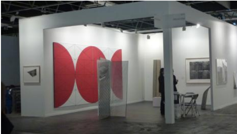
Stand de ProjecteSD. ARCO 2013.

continúa lo que pudimos ver de Oriol Vilanova en Quizás es cierto en teoría que siguiendo un discurso completamente distinto se relacionaba en el display con la instalación de las escenas de vida de Elmgreen & Dragset en Helga de Alvear , cuya obra de DJ Simpson presente en el exterior del stand dialogaba bien con el Imi Knoebel que presentaba la galería de enfrente a la suya.