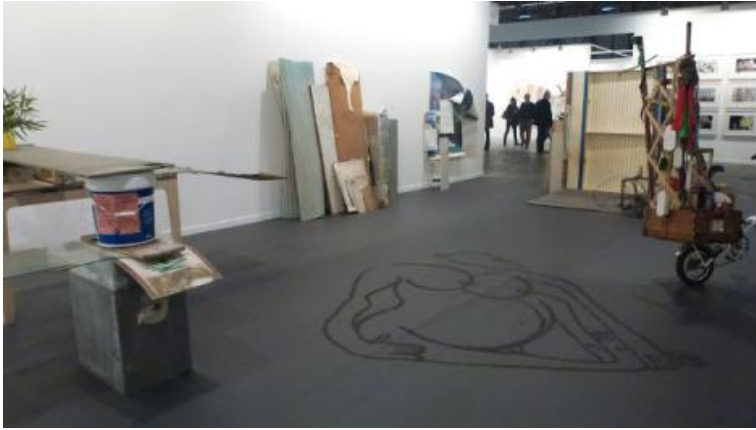
Abraham Cruzvillegas, Galería Chantal Crousel. ARCO 2013.

Algo de crítica a la economía, o bien de reflexión entorno a las formas de subsistencia y creación hemos visto en el stand de Chantal Crousel , enteramente dedicado a las assamblages de objetos y materiales de deshecho de Abraham Cruzvillegas , sobre la precariedad y sus formas para encontrar salida parecían hablarnos la funcionalidad trouvée del artista mexicano.