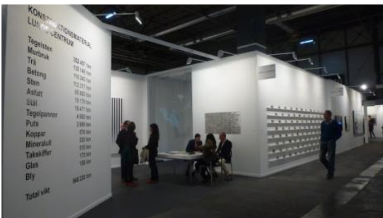
Vista del stand de Parra & Romero. ARCO 2013.

Si nos esforzamos por encontrar otras apuestas, más poéticas y no por ello menos comprometidas, las encontramos en el stand de Esther Schipper por ejemplo, muy teatral con la escenificación de Liam Gillick a través de unas esculturas que envolvían el marco de las puertas y que más bien parecían los cortinajes de un escenario que daban paso a otra instalación, silenciosa, arenosa y muy poética, la de Dominique Gonzalez-Foerster . Muy bien también para Parra&Romero , con una instalación que