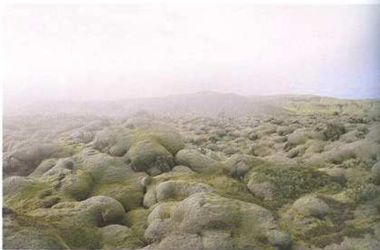
Vicente Tirado del Olmo, You're Buying a Belief 2011. Fotografia 110x150 cm. Galeria Cíenex.

en el preu de l'estand, en què nosaltres presentarem l'obra d'artistes consagrats com ara Picasso i Miró. En tot cas, Arco és un fira molt important i hi hem de ser." Amb l'inici d'any, però, saltava de nou la notícia. Les galeries que havien decidit no anar a Madrid s'ho repensaven i finalment anunciaven la seva presència a la fira. Bé, totes no, Estrany-De la Mota en quedava fora. "No tenim cap problema amb la fira —explica Antoni Estrany—, tot al contrari, fa anys que hi anem i pensem que és factible que l'any que ve s'escollint les nostres exigències, que són comparatives amb moltes altres galeries de la