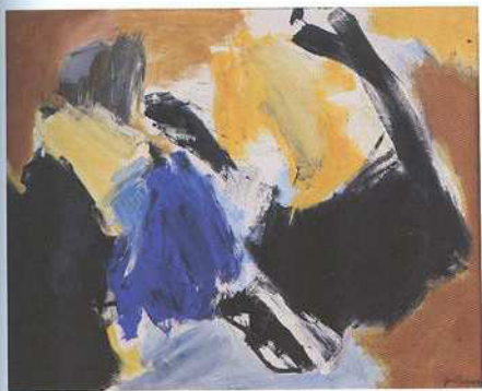
José Guerrero, "Black & Yellow", 1960. Oli sobre tela, Galeria Ortiz.