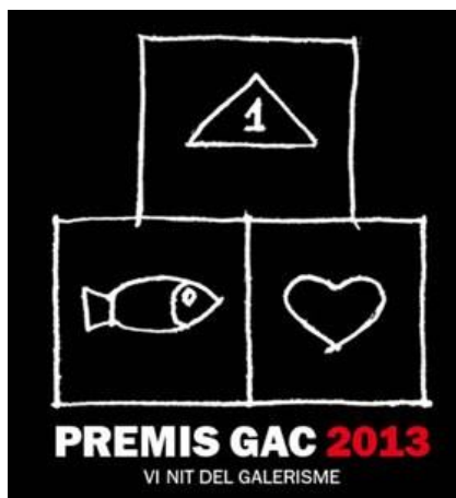
Logo de los Premios GAC 2013 - VI Noche del Galerismo