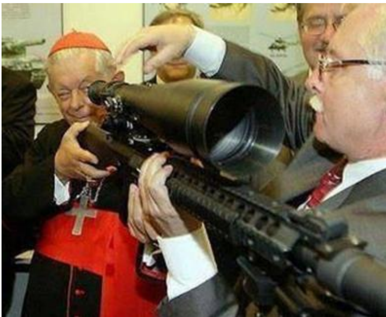
Cardenal probando un arma de la marca Pietro Beretta Ltd. Imagen central de la instalación de AMD #2: Ad Pias Causas

Estas hostias se van a colocar en una instalación, alrededor de un cuadro de gran tamaño que es la reproducción de una foto que encontré en la prensa de un alto cargo religioso del Vaticano probando un arma en una feria de armamento. La idea es "vender" las hostias a cambio de la voluntad de la gente, y el dinero recaudado se va a destinar a pagar a unos profesionales para que diseñen un plan para asaltar al Banco del Vaticano. El el objetivo es expropiar sus bienes, con la peculiaridad de que en el plan se utilizarían todas las armas que ellos mismos financian.