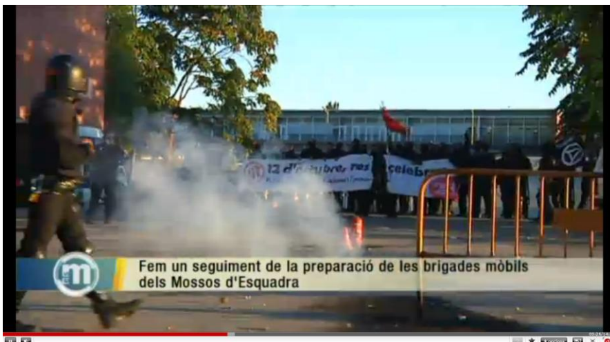
Vídeo de un entrenamiento de los Mossos d'Esquadra. El Síndrome de Sherwood

El título de la tesis es el mismo que el de mi exposición. Y voy a hacer tres cosas: en el aparador estamos negociando poner todo el material con el que entrenan los antidisturbios. O sea, las pelotas de goma, las escopetas... y también la indumentaria con la que se disfrazan para entrenar: en los entrenamientos hay unos que hacen de antisistema y otros que son los mossos. Y, por ejemplo, vi un vídeo de estos entrenamientos en el que llevaban una pancarta que decía "12 d'octubre res a celebrar" (12 de octubre nada que celebrar)... Así que se expondrán también las pancartas para poner en evidencia toda la carga ideológica que hay detrás de este grupo de policías.