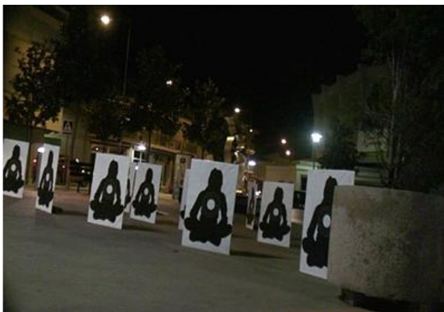
Dianas instaladas en la plaza, 54mm