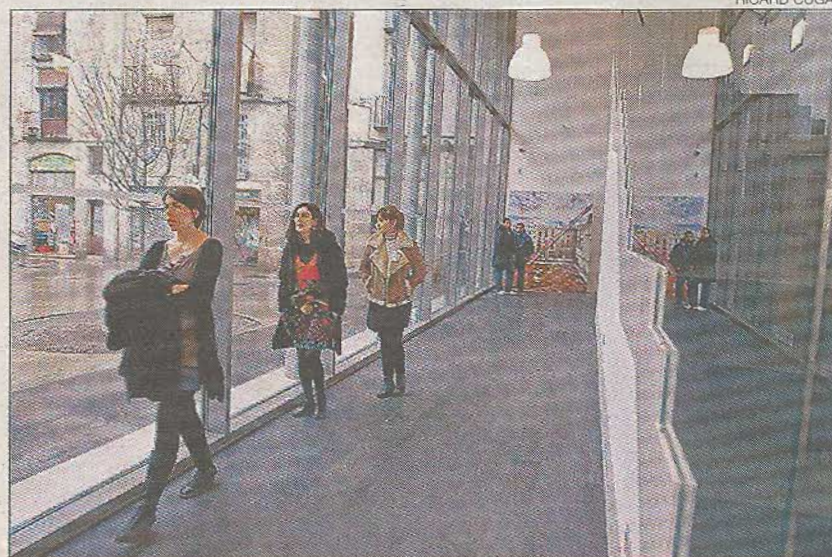
►► Uno de los espacios del nuevo centro de investigación.

El centro, con un coste de 6,7 millones de euros, está equipado con las herramientas necesarias para gestionar la documentación y el conjunto de información existente sobre Picasso y facilitar el aprendizaje de la obra del artista. En definitiva, se trata de un intento de reforzar