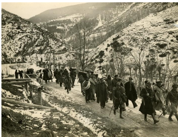
Esteve Subirah, Forma 17 , 2014

resultado de prejuicios y deseos que proyectamos sobre estas representaciones, de tal manera que queda en suspenso la relación semántica entre paisaje e imagen.