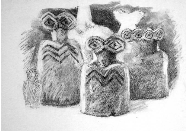
Buenas Intenciones (2016)

A través de documentación, la muestra de las antigüedades, material gráfico y la explicación de la campaña de recaudación de fondos, Güell y Orta crean un entramado de intenciones y voluntades que discute, en último lugar, cuestiones fundamentales como la mirada colonial y del privilegio, la condescendencia de Occidente hacia el patrimonio cultural y qué es lo que ocurre cuando la buena intención deviene mercancía.