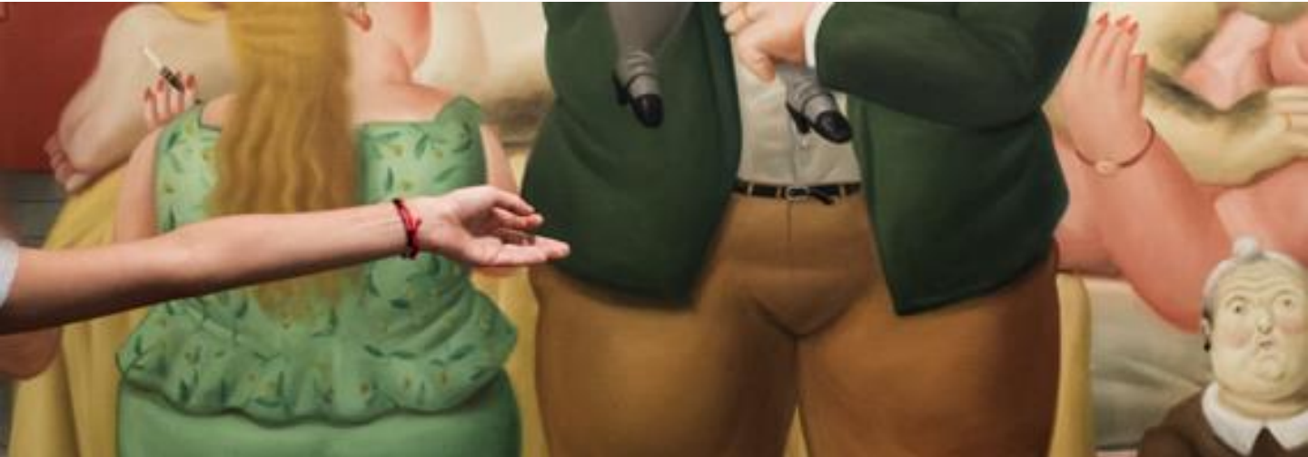
La feria de las Flores (2015-2016)