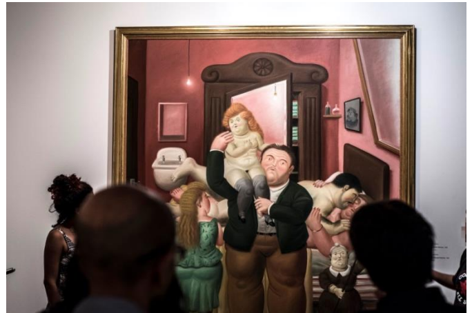
La feria de las Flores (2015-2016)