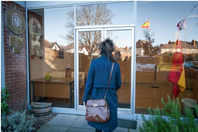
Apátrida por voluntad propia (2015)

La muestra aporta un relato audiovisual y documentación que acredita todo lo ocurrido hasta la fecha.