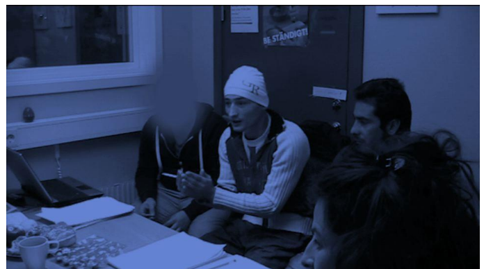
Support Swedish Culture (2014)

"Si hemos llegado a un acuerdo que está escrito en un papel, ¿cómo pueden decir que el artista me está usando cuando yo he firmado un contrato acordado previamente? ¿Acaso creen que no sé lo que firmé?"