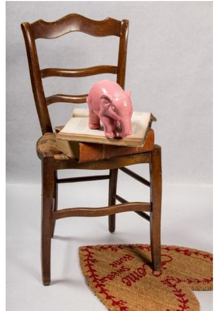
Huyendo de mí mismo hacia una muerte súbita (2015).

Esta película, que fue proyectada por primera vez en el Museo Nacional Centro de Arte Reina Sofía (MNCARS) de Madrid el pasado octubre de 2015, retoma una de las facetas menos conocidas y exploradas de Pazos: la de cineasta. El artista, que invirtió 3 años de trabajo intenso y obsesivo para realizar el film, reúne fragmentos seleccionados de entre más de 1.800 películas – desde grandes producciones americanas a cine de autor, de terror o serie B, y desde finales del s. XIX hasta films actuales - que plantean los clichés y estereotipos alrededor del concepto de artista y la trivialidad del arte manejado por las industrias culturales, creando, a partir de ellos, su particular collage sobre lo que para él aún existe en la imaginación colectiva: un gran collage del universo de las artes plásticas y literarias.