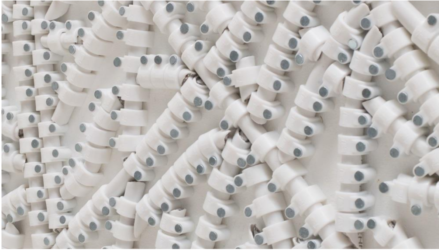
mounir fatmi Racines 08 , 2016

The Observer Effect , l'exposició que ara presentem, reuneix una sèrie de produccions recents amb les quals l'artista explora noves maneres de creació a partir d'elements que ja són paradigmàtics de la seva obra com la tecnologia analògica i la paraula escrita. El títol fa referència a la teoria de la física quàntica mitjançant la qual l'observador influeix en la matèria observada. Una cosa similar al que es coneix en psicologia com l'efecte Hawthorne que estableix modificacions en el comportament dels individus en resposta a l'autoconsciència de ser observats. Anàlogament, Marcel Duchamp va declarar: "Crec sincerament que la pintura és tant de l'espectador com de l'artista". Amb aquestes referències, mounir fatmi proposa que l'espectador se sotmeti a l'observació d'una manera inusual, mirar i ser vist des d'un altre punt de vista, transformant i alterant les obres en un joc de reciprocitat.