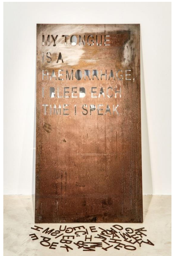
mounir fatmi Coma Manifesto 03, 2017

Ha rebut diversos premis, incloent el Premi Uriöt, Amsterdam; el Gran Premi Léopold Sédar Senghor en la 7a Biennial de Dakar en 2006; i el Premi de la Biennial del Caire en 2010.