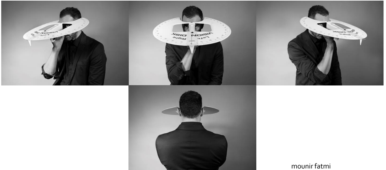
mounir fatmi Peripheral Vision , 2017

Al costat d'aquest es mostra Peripheral Vision , una sèrie de quatre retrats fotogràfics en blanc i negre on veiem al propi mounir fatmi de front, des de darrere, i des dels costats. El rostre desapareix parcialment darrere d'un gran utensili geomètric per mesurar a través del qual veiem només els ulls de l'artista. El muntatge recorda a l'estètica futurista mentre que els diferents enfocaments revelen una manera de renovar la mirada, una nova consciència del que ens connecta amb el món que ens envolta i amb els seus límits. No obstant això, el que Peripheral Vision destaca són les mancances del llenguatge estètic i la incapacitat de l'artista per a traduir les seves idees. A això se suma la importància de la mirada de l'espectador que inverteix temporalment la seva posició amb l'artista en fer d'aquest últim un observador atent del públic que passa per la sala.