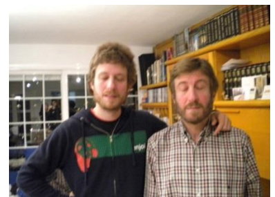
Yo y yo en 20 años / Mi padre y mi padre hace 20 años

Anny De Decker Collection, Amberes Francisco Cantos Collection, Madrid Urbano Collection, Madrid Fundación Montemadrid, Madrid Arxiu del Centre d'Estudis i Documentació del MACBA, Barcelona Centro de Documentación y Biblioteca del MNCARS, Madrid MoMA Library, Nueva York